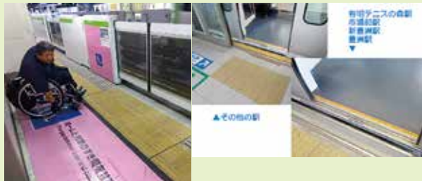
車いす等昇降場所は段差・隙間対応している表示を目立つように工夫!