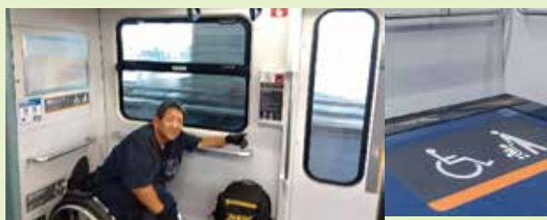
車いす・ベビーカー優先スペースは表示もわかりやすくなっていて緊急時に運転手・駅員への連絡できるように画像確認もできるインターフォンが設置