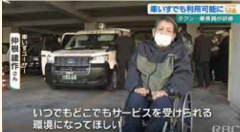
いつでもどこでもサービスを受けられる環境になってほしい