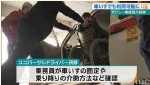
ユニバーサルドライバー研修 乗務員が車いすの固定や乗り降りの介助方法など確認