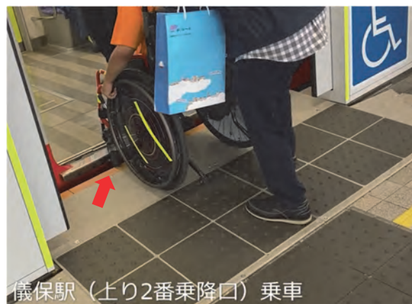
儀保駅（上り2番乗降口）乗車

現在のゆいレール駅で使用されている「駅員さんによるリモコンでの可動式スロープ」が、大阪の駅では、車両がホームで停まったときに自動でスロープが稼働し段差と隙間がない状況になる仕組みにしていますので、ゆいレールもいつの日か整備してほしいですね。