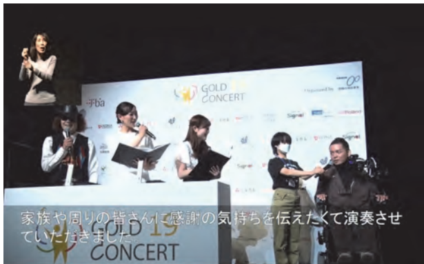
家族や周りの皆さんに感謝の気持ちを伝えたくて演奏させていただきました。

会場には家族以外にも私が受傷した当時、一緒に勤務していた先輩方や同僚、上司の方も来ていただい