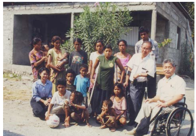
DPIの要請で、独立前の東チモールの障害者の調査をした時の写真。武装した民兵がいる時代でした。

ハワイから帰国後、私は、障害者運動やリハビリテーションの仕事で、5年間東京や横浜市で仕事をしました。更に、1981年にシンガポールで開催された障害者インターナショナル(DPI)の創立総会に参加したことをきっかけに、1990年4月に、タイ・バンコクにある国連アジア太平洋経済社会委員会の社会開