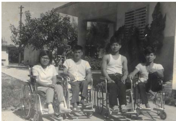
首里石嶺にあった沖縄県立更生指導所の仲間達と。私は下肢装具をつけています。

私は、高校のクラブ活動の器械体操中に落下して胸髄12番を損傷した。当時の八重山病院では治療が難しく翌日那覇の病院に空輸された。その病院には、頸髄、脊髄損傷者が私以外に3人いた。皆2、3年の長期入院者だった。いや自宅に戻れなく滞留していたと言った方が良いだろう。私は、若かったので病院に一生涯閉じ込められるのが恐ろしくて、一年半の入院後、自分で行き先を探して退院した。そこは沖縄県障害者更生指導所というところだった。