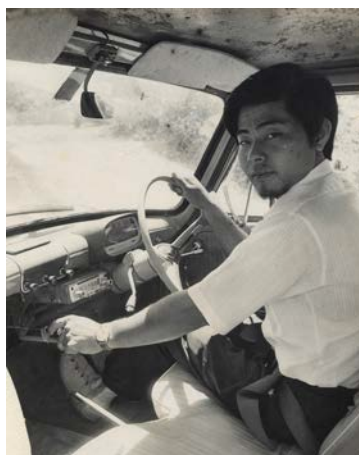
兄が改造してくれた手動式装置のついた車です。恐らく沖縄県で初めての装置だと思います。復帰前で、簡単に改造し免許が取れました。

自宅、学校、職場、公共施設などどこもバリアだらけだったので、車椅子のみでの活動は難しかった。施設を出て、私が当時の沖縄キリスト教短期大学（現在の沖縄キリスト教学院大学、以後、キリ短）に入学できたのは奇跡的とも言える。私は、高校を中退して高校卒業資格検定試験を受けて受験資格はあったが、車椅子の私が受験できる大学はなかった。思い切って、キリ短に相談したところ、学長が面談してくれることになった。面談の時、できるだけ支援したいとのことで、受験が可能となり、入試を受けて合格できたのである。当時のキリ短の校舎は20メートル程の丘の上にあった。そこには車道があったが車椅子では到底登れない坂だ。私の兄は自動車修理工場を営んでいたの、オートマチック車を手動