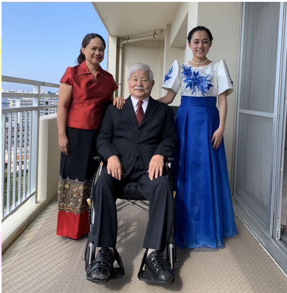
今年の成人の日に娘と共に写した家族写真