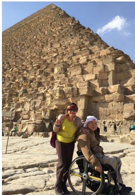
2015年11月に国際協力事業団の仕事でエジプトへの出張でピラミッドに立ち寄った