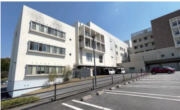
熊本リハビリテーション病院

6時に起床後、ホテルのチェックアウトの準備をして、8時タクシーにて熊本リハビリテーション病院に向け出発。病院に8時50分到着しPCR検査を行い陰性確認後に入院手続きが始まる。制限区域を調整された通路で病室に到着、病棟看護師から担当看護師を紹介され、病棟での注意事項や食事、テレビ、SCセット、入院同意書、身元保証人などの説明を受け、事前に準備をしていた書類を提出する。コロナ過とあって病棟階以外へは、立入制限や外出禁止と言った厳しい状況でした。