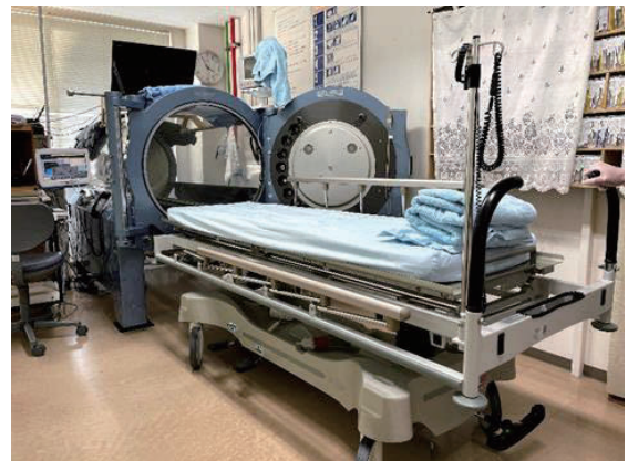
高気圧酸素治療器

高気圧酸素治療は、大気圧より高い気圧環境の中で、酸素を吸入することにより病態の改善を図ろうとする治療です。