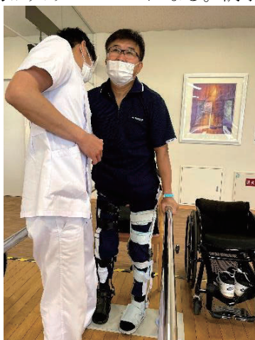
平行棒にて歩行訓練

2) 長下肢装具を付けて、長さ3mの平行棒にて腰から足を振り歩行練習を、1往復する。ここで、転倒を用心し腕に力が入りパンパンになる。調子が良い時は、平行棒を2往復する。